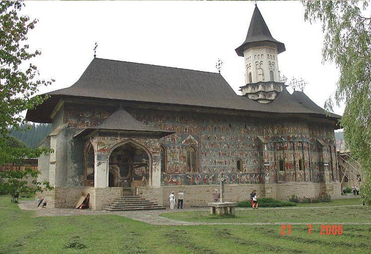
Sucevita - Agapia