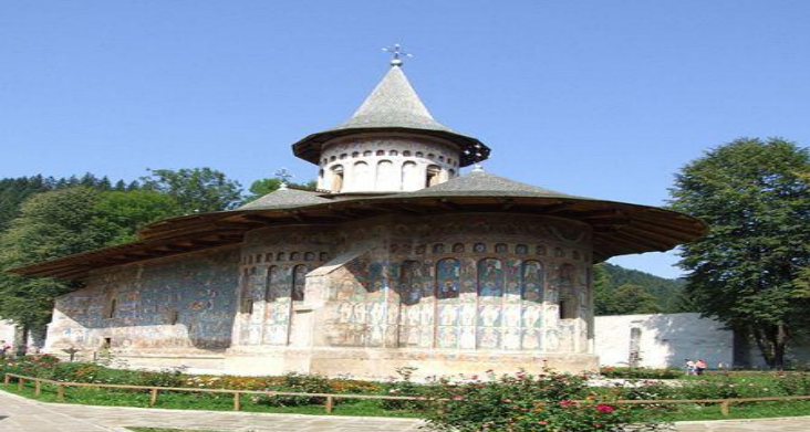
Voronet - Humor

➤ Η Ρουμανία είναι από τις πλέον θρησκευόμενες χώρες και έχει τα περισσότερα ορθόδοξα μοναστήρια από κάθε άλλη Ορθόδοξη χώρα . Ιδιαίτερο χαρακτηριστικό των μοναστηριων της ρουμανιας είναι η εξωτερική εικονογράφηση των τοίχων και ιδιαίτερα στα “ζωγραφισμένα μοναστήρια” στην περιοχή της Μπουκοβίνας τα οποία έχουν χαρακτηριστεί από την Unesco ως παγκόσμια πολιτιστική κληρονομιά